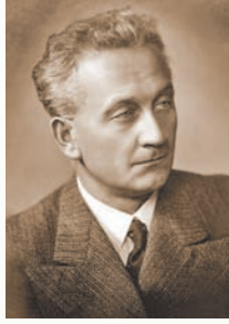
एल्बर्ट सेंट जॉर्जी