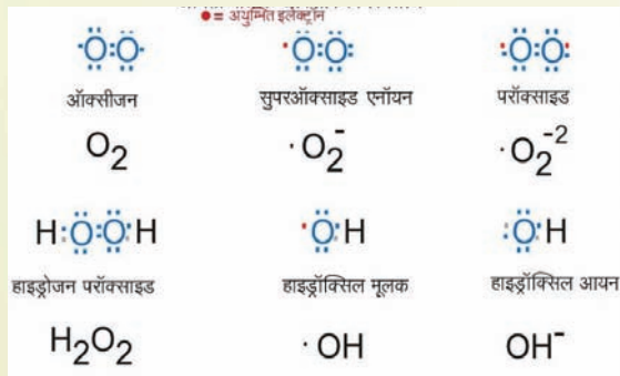
अभिक्रियाशील ऑक्सीकरण स्पिशीज

की प्रक्रिया तेज हो जाती है। मुक्त मूलक से त्वचा पर झुर्रियां पड़ने लगती हैं और शरीर के अंगों की कार्यक्षमता कम होने लगती है। मुक्त मूलकों में एक